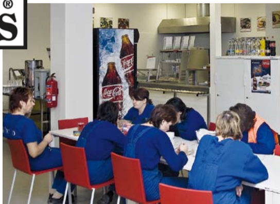
HILL'S PET NUTRITION MANUFACTURING

Jsme moc rádi, že se Aramark stal součástí týmu dodavatelů této nadnárodní organizace, která se rozhodla využít našich služeb s ohledem na vysokou kvalitu poskytovaného servisu. Do jídelny v tovární hale dovážíme jídla ve zvýšené gramáži (150 g a 200 g masa), standardní a minutkové pokrmy doplňuje pestrá nabídka zboží v doplňkovém prodeji. S ohledem na plánovanou expanzi firmy Hill's se těšíme na rostoucí počet spokojených strávníků, kteří rozšířili řady našich klientů.