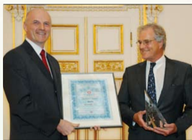
Aramark získal ocenění ÚSPĚŠNÁ FIRMA