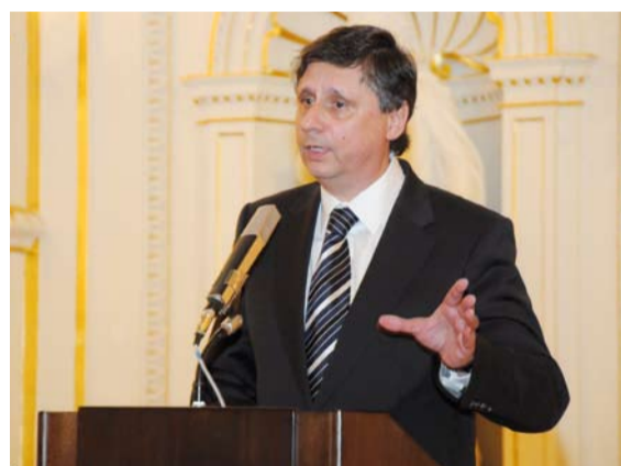
Prime Minister Jan Fischer

In 2009 Aramark participated in the 15 th Annual Czech Republic National Quality Award. Based on the results achieved, the Jury, at its October session, decided to award our Company with the title SUCCESSFUL COMPANY – the highest possible award in the business sector for the START model.