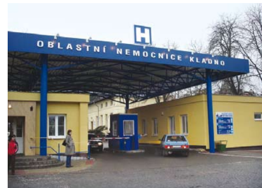
OBLASTNÍ NEMOCNICE Kladno

Jsme moc rádi, že se Aramark stal součástí týmu dodavatelů této nadnárodní organizace, která se rozhodla využít našich služeb s ohledem na vysokou kvalitu poskytovaného servisu. Do jídelny v tovární hale dovážíme jídla ve zvýšené gramáži (150 g a 200 g masa), standardní a minutkové pokrmy doplňuje pestrá nabídka zboží v doplňkovém prodeji. S ohledem na plánovanou expanzi firmy Hill's se těšíme na rostoucí počet spokojených strávníků, kteří rozšířili řady našich klientů.