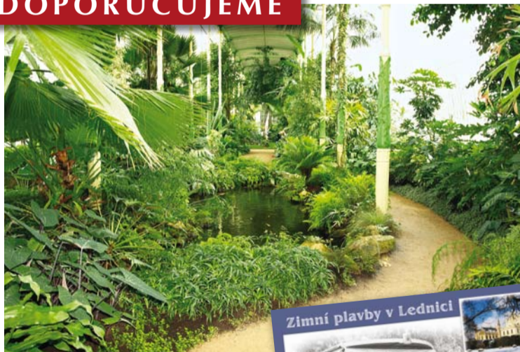
Zimní plavby v Lednici